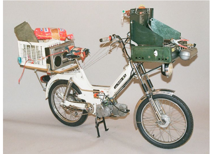
Pat McCarthy, CheeseBike , 2010 (en cours), cyclomoteur Puch, poêle Coleman, techniques mixtes, dimensions variables.